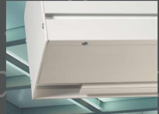
Abbildungen: ProfiIntegral in RAL-Ausführung