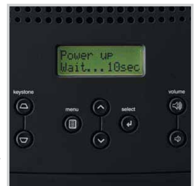
Ein 12-sprachiges, interaktives Display bietet Statusinformationen in Echtzeit. Das Anwender freundliche Tastaturfeld ermöglicht die Steuerung der meisten Funktionen mit einem Tastendruck.