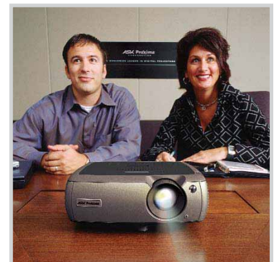
Einfache Bedienung, einfacher Aufbau und einfach im Team zu nutzen.

Durchdachte Innovationen machen projizieren einfacher als jemals zuvor: Vom Aufbau und Bedienung bis hin zu den optionalen Funktionen und der Verwaltung. Ein Tastendruck, sofortige Projektion und unvergleichlich einfache Bedienung lassen Sie ohne jede Hektik präsentieren. Es ist unsere Design-Philosophie, ProjectAbility™, die in jedem ASK Proxima Projektor umgesetzt ist und Ihnen den Präsentationserfolg garantiert.